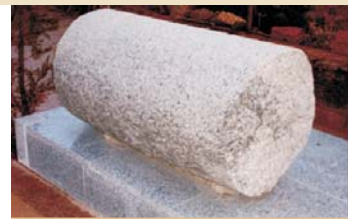
Rulo de Era

En esta pila el herrero introducía la pieza de hierro incandescente para templarla. Estaba dentro de la fragua del pueblo, situada al lado del potro; era de propiedad municipal.