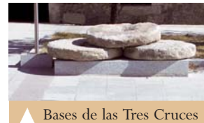
Bases de las Tres Cruces