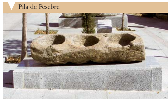
Pila de Pesebre