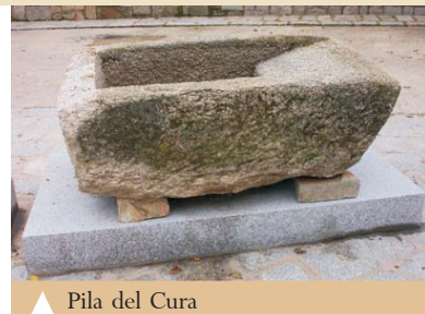
Pila del Cura

Es la pila que había en el patio de la casa del cura y fue donada por el cura D. Federico. Estaba situada junto al pozo y era utilizada antiguamente para lavar las ropas del cura.