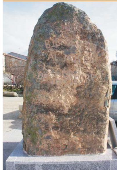
Piedra de Molino